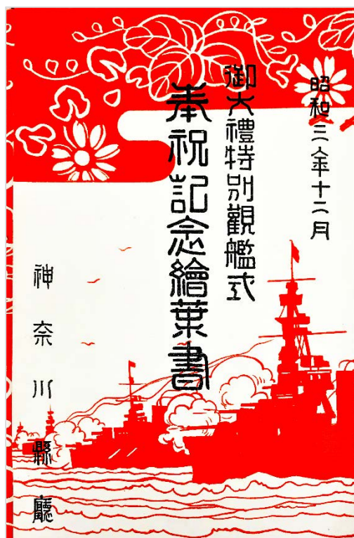
「御大禮特別観艦式奉祝記念繪葉書」 神奈川県 1928年

新しい時代。それはどのように訪れて、どう伝えられてきたのでしょうか。 令和のはじまりを記念して、各時代に行われた儀式と、改元にまつわる資料をご紹介します。