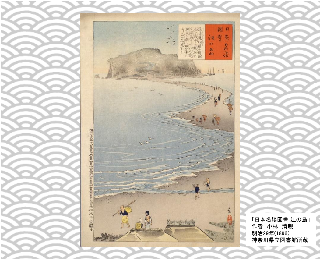
「日本名勝図會 江の島」 作者 小林 清親 明治29年(1896)