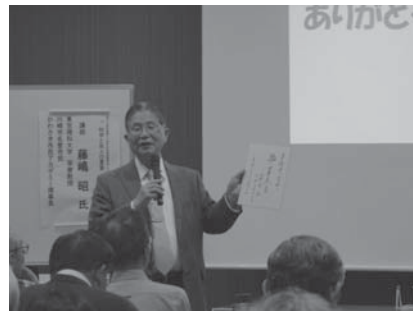
写真 1 講演会「科学と先人の言葉」の様子

県立川崎図書館 60 周年記念連続講演会を開催しました。(その 1)は東京理科大学名誉教授の藤嶋昭氏を講師に迎え「科学と先人の言葉」を開催しました。