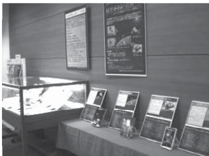
写真4 「『はやぶさ2』の技術」の展示の様子

当館の資料を用いて、小惑星探査機「はやぶさ2」の装置がどのような技術で作られているかを紹介しました。