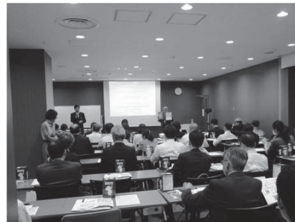
写真 2 社史編纂サポートセミナーの様子

2012 年より開催。社史を刊行した企業の方に、社史編纂の流れと、社史を編纂した際の苦労話や工夫した点、エピソードなどをお話しいただくものです。社史編纂の参考にしていただける、人気のセミナーです。