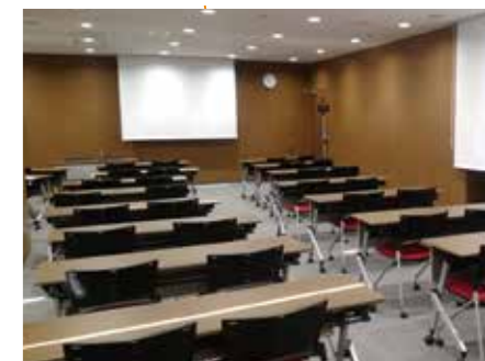
カンファレンスルーム