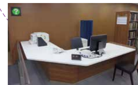
専門相談カウンター