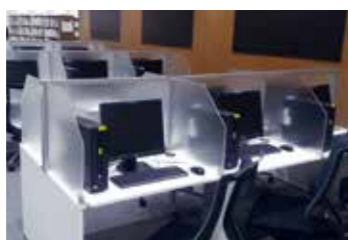
電子ジャーナル・データベース